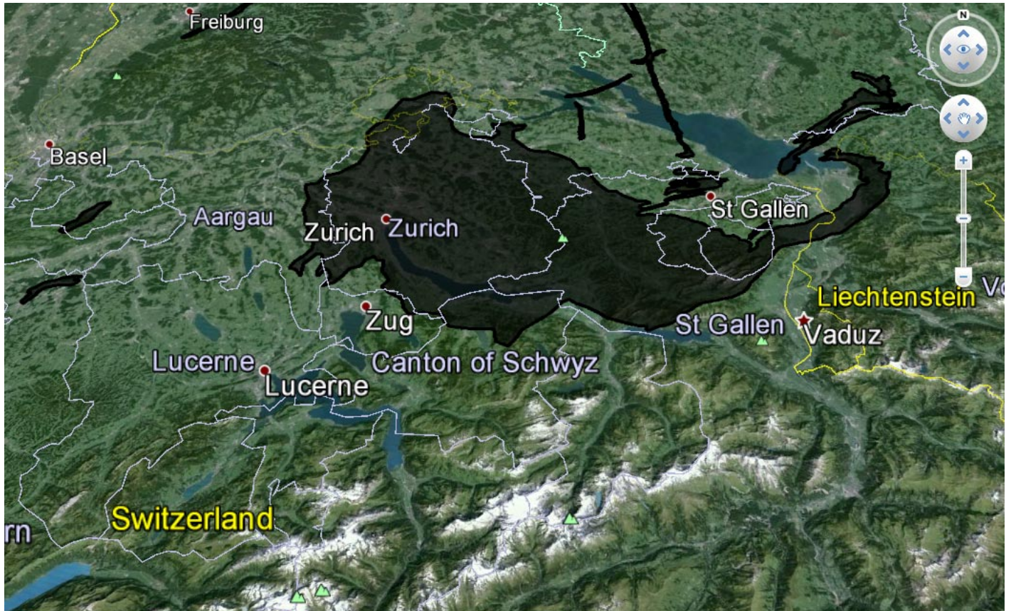
Der Ölteppich in der 3D-Darstellung von Google Earth

Eine ähnliche Applikation , die allerdings auf der 3D-Darstellung von Google Earth basiert, hat Paul Rademacher erstellt. Die dazu erforderlichen Daten kann im übrigen jeder auf der Webseite von Google Crisis Response herunterladen.